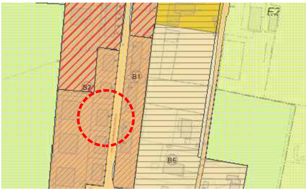
PIANO INTERVENTI Zona residenziale 3 di completamento Scala 1:2000