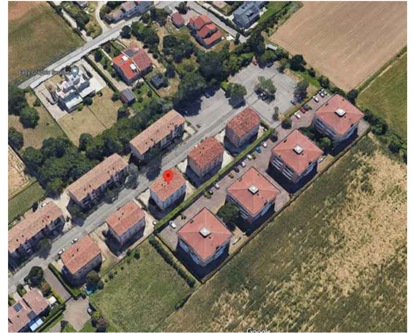
A poca distanza dall'edificio oggetto di intervento è presente un ampio spiazzo utilizzabile per la manovra dei mezzi o per il loro temporaneo parcheggio.