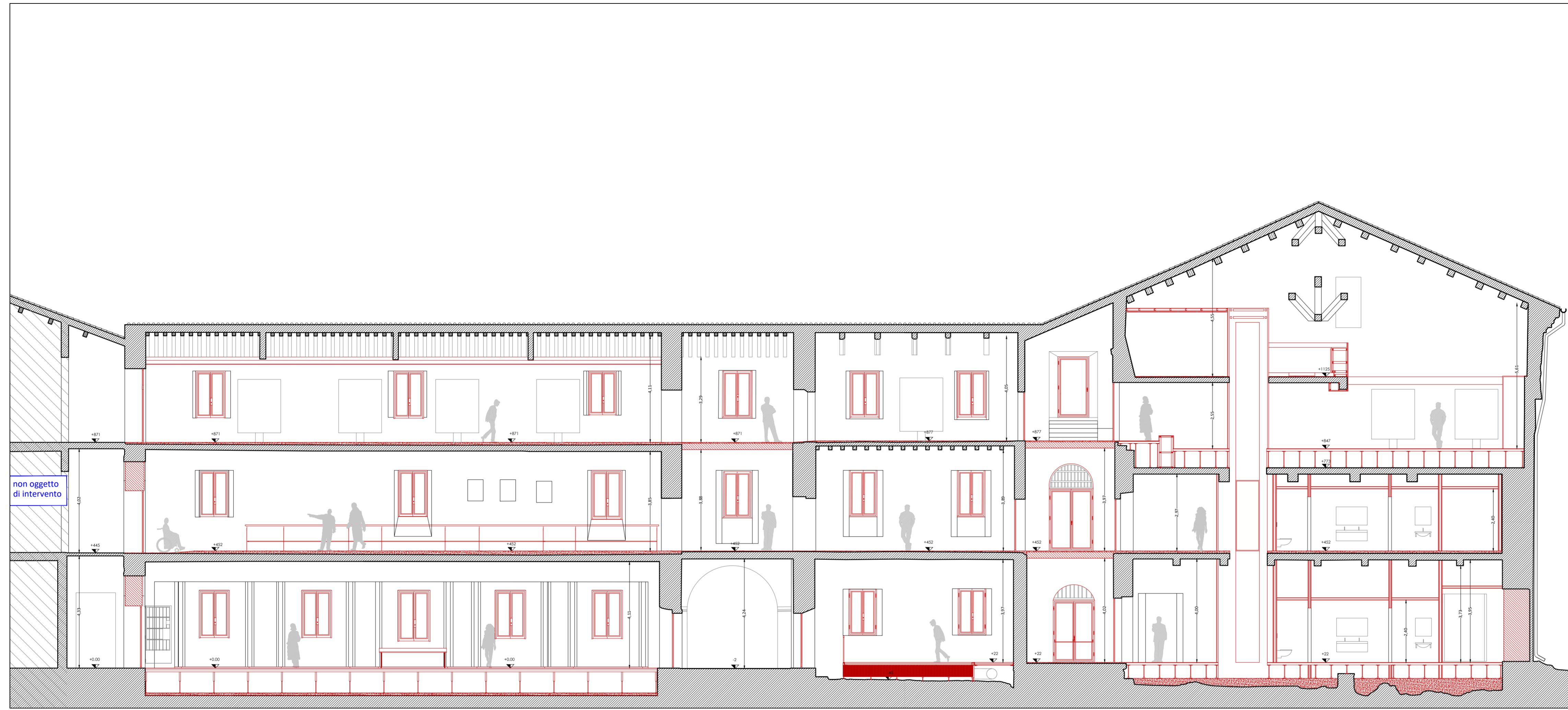
Sezione AA' - scala 1:100