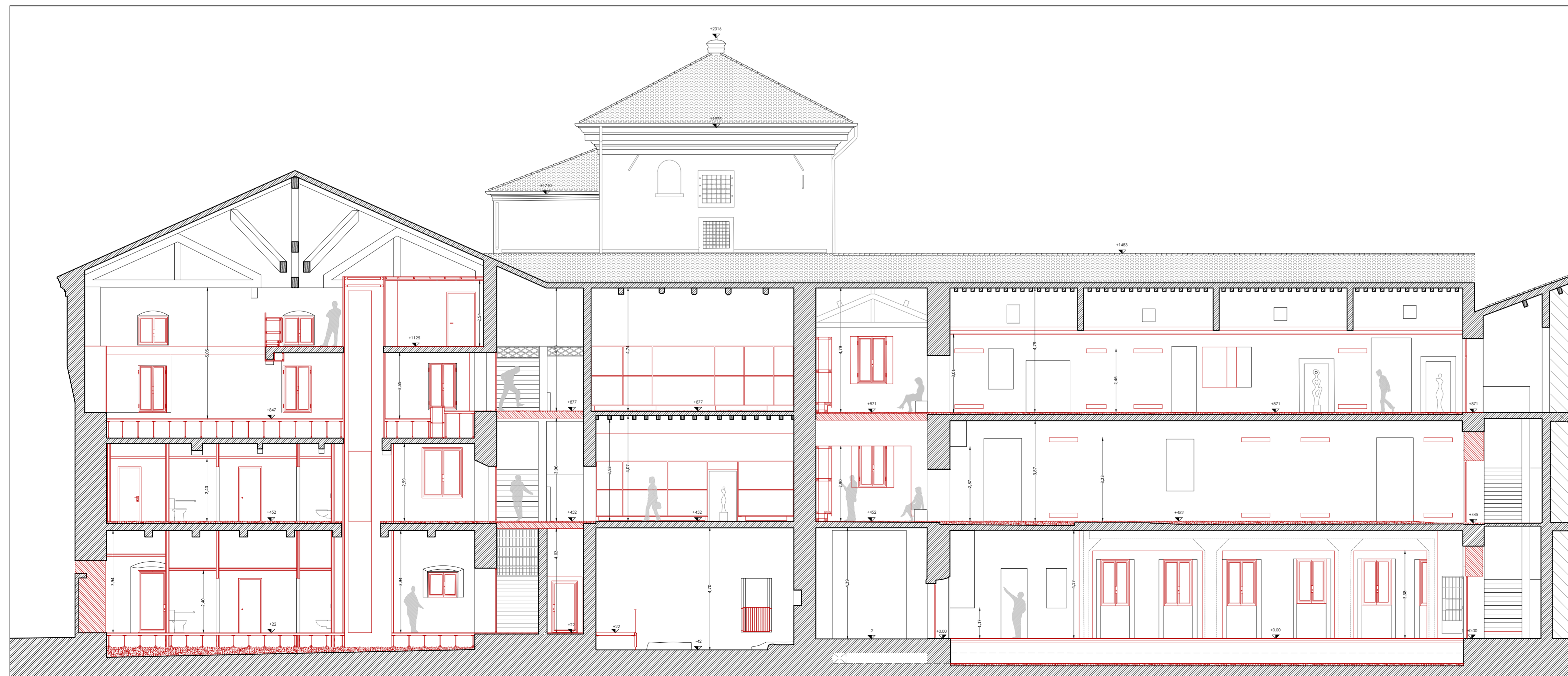
Sezione BB' - scala 1:100