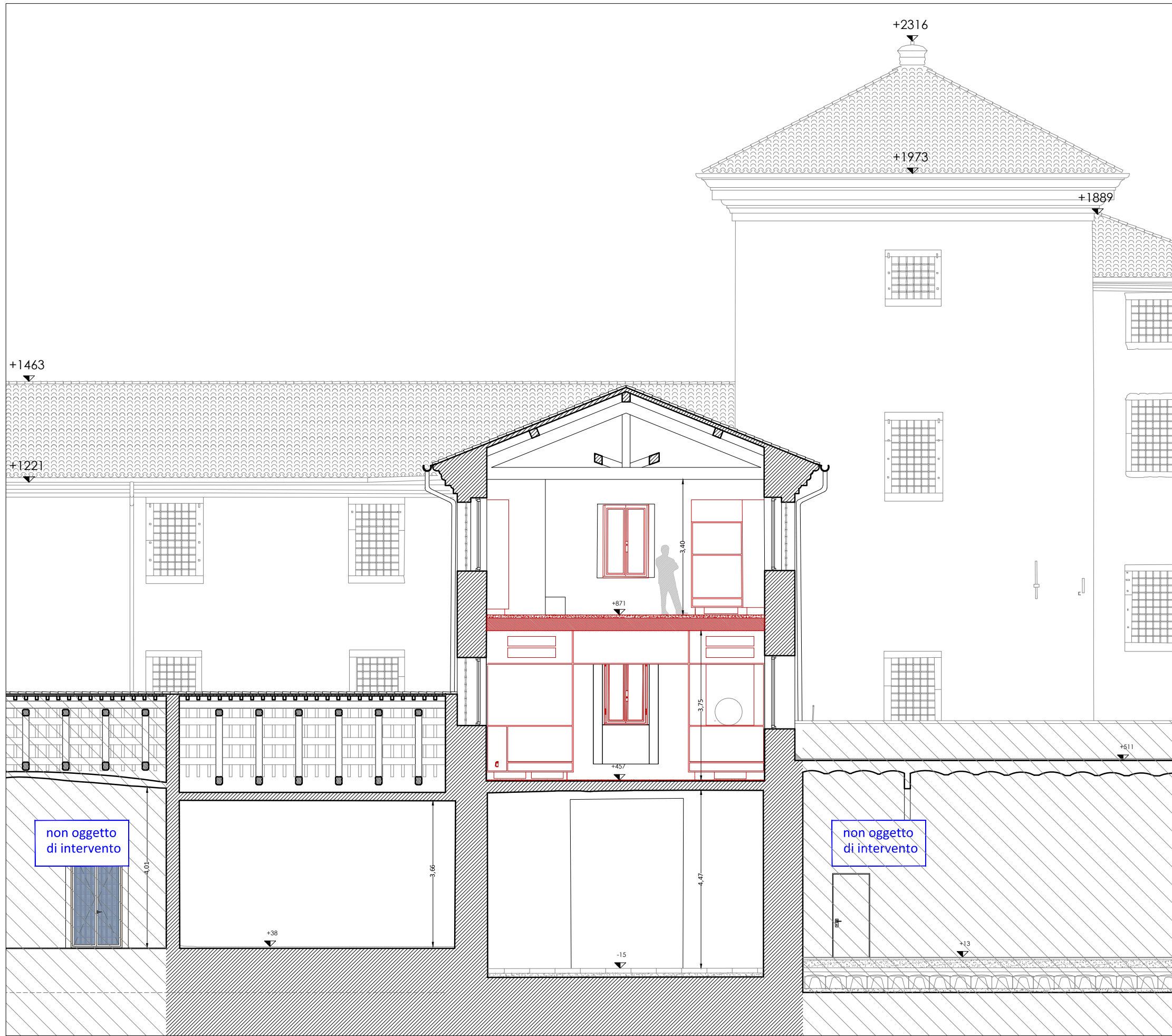
Sezione CC' - scala 1:100