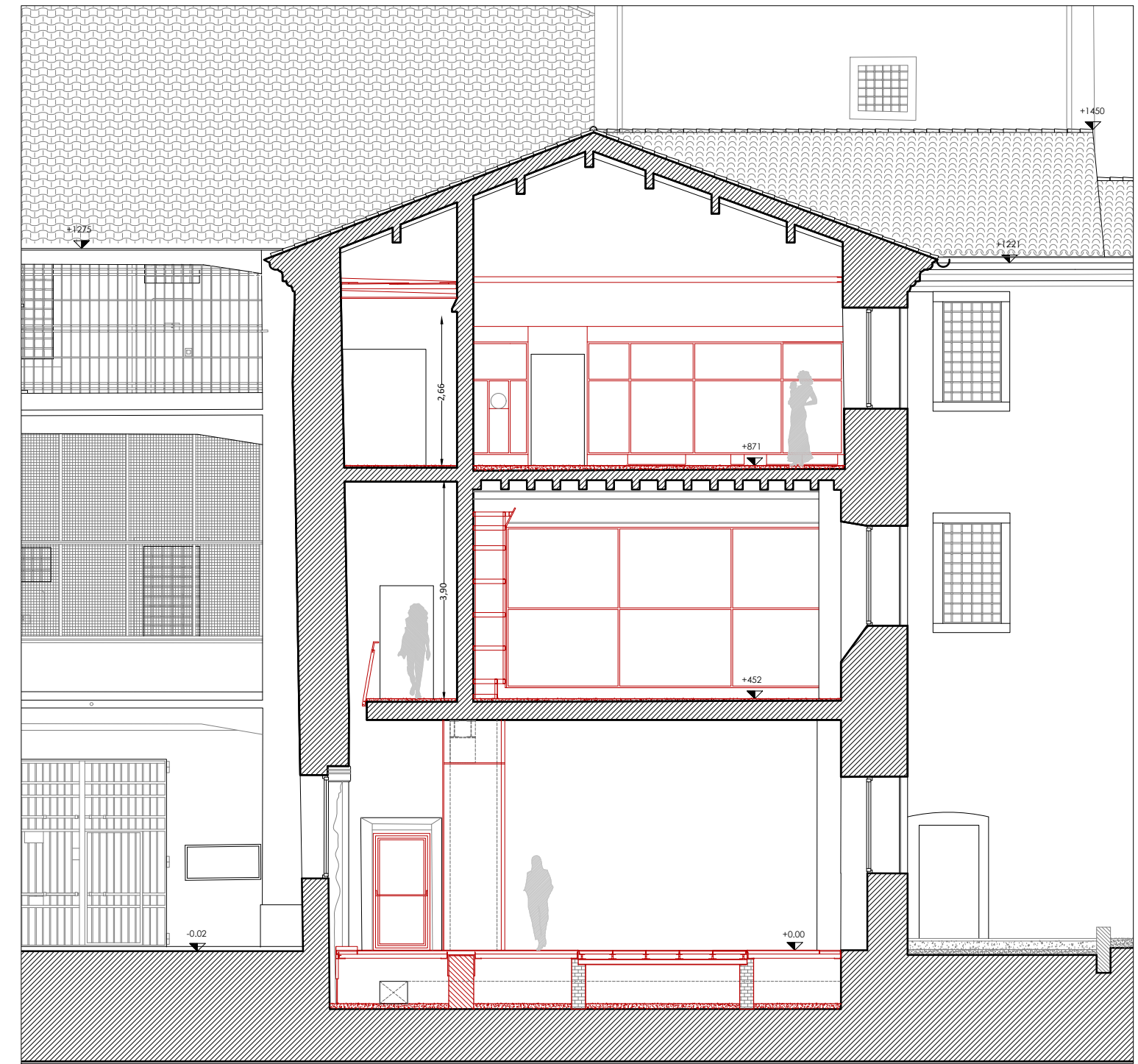
Sezione DD' - scala 1:100