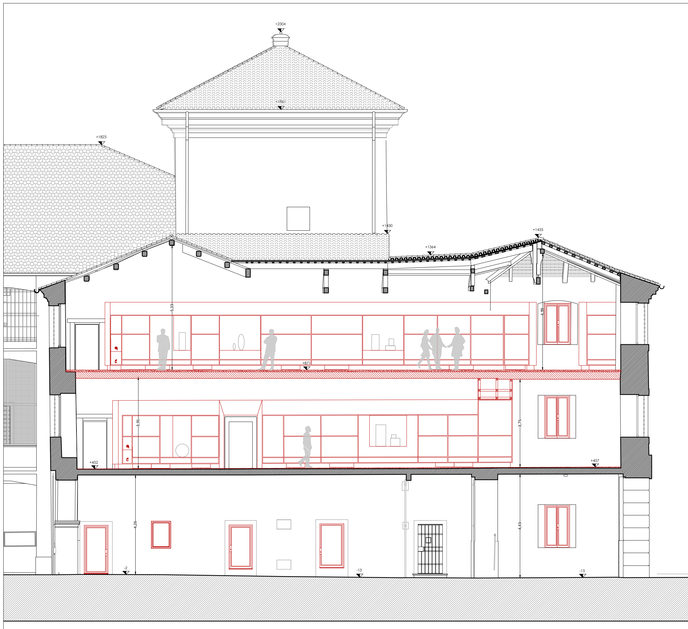
Sezione EE' - scala 1:100