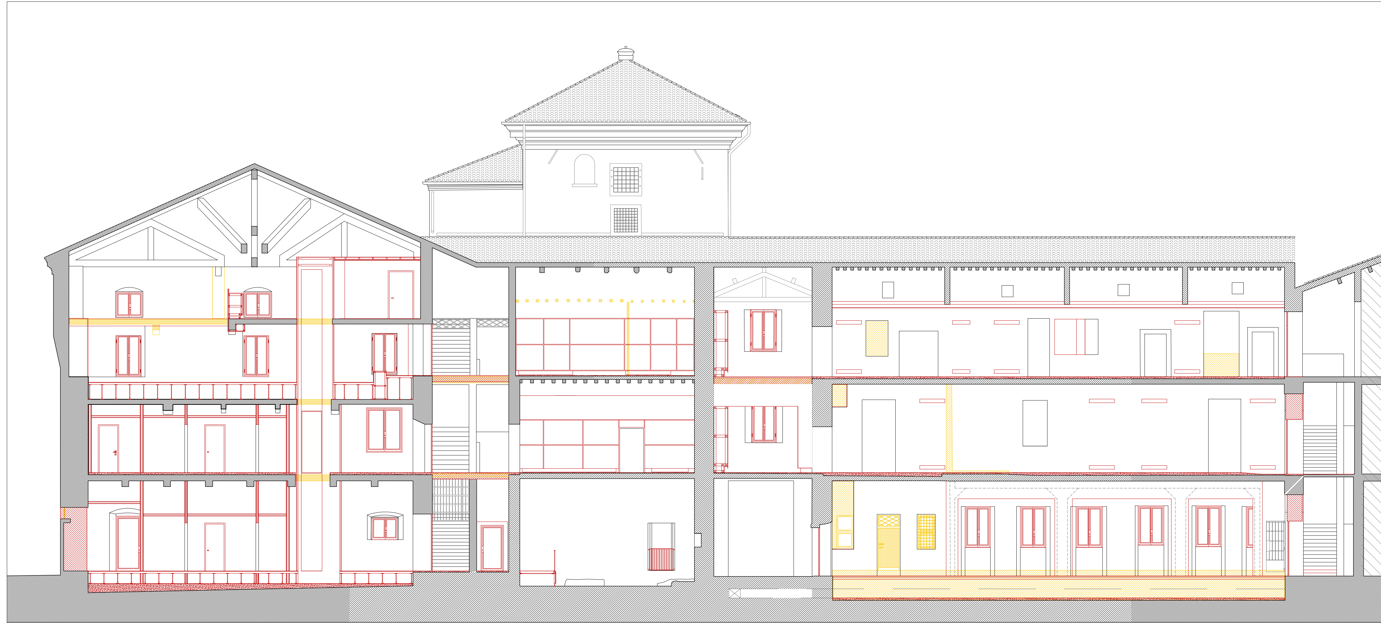
Sezione BB' - scala 1:100