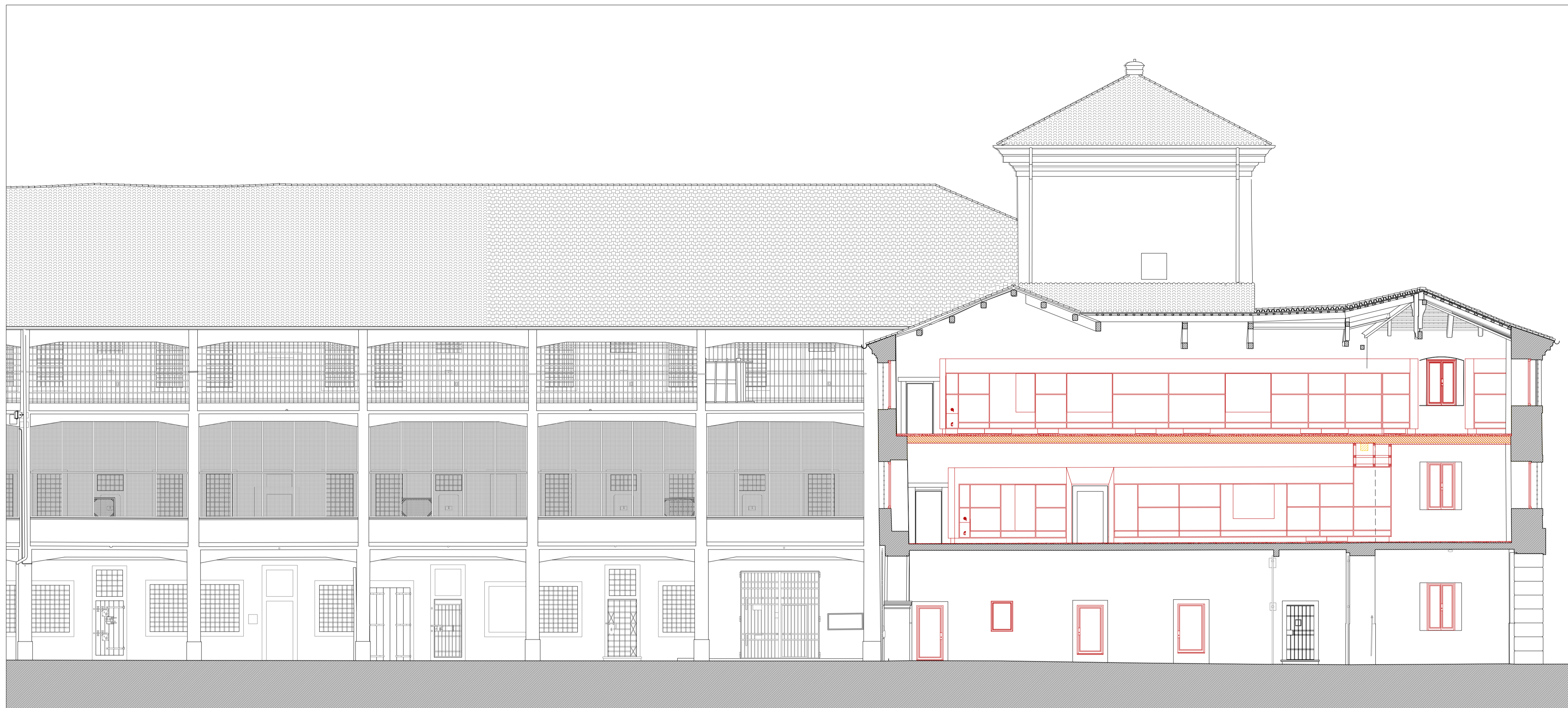
Sezione EE' - scala 1:100