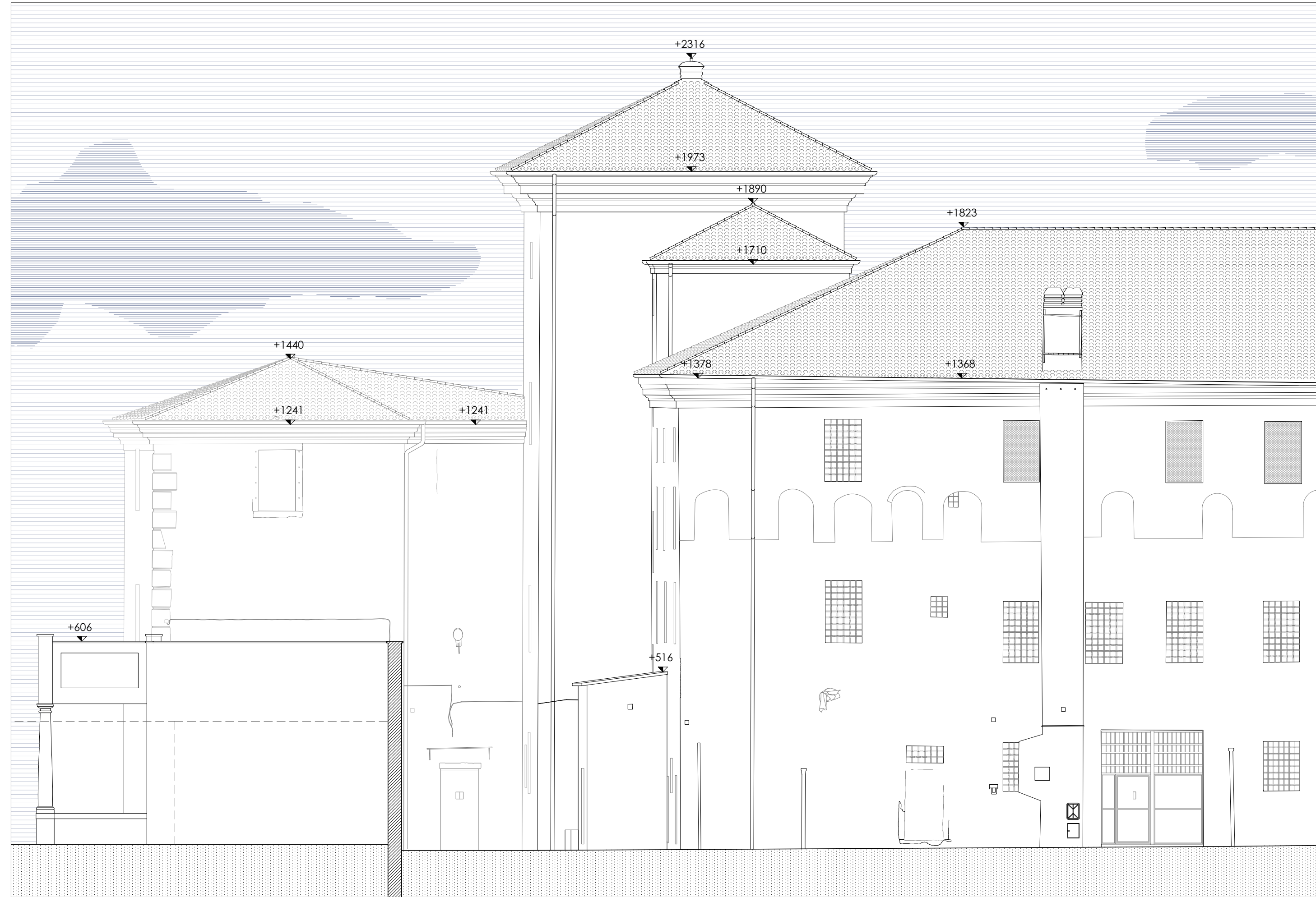
Prospetto N - scala 1:100