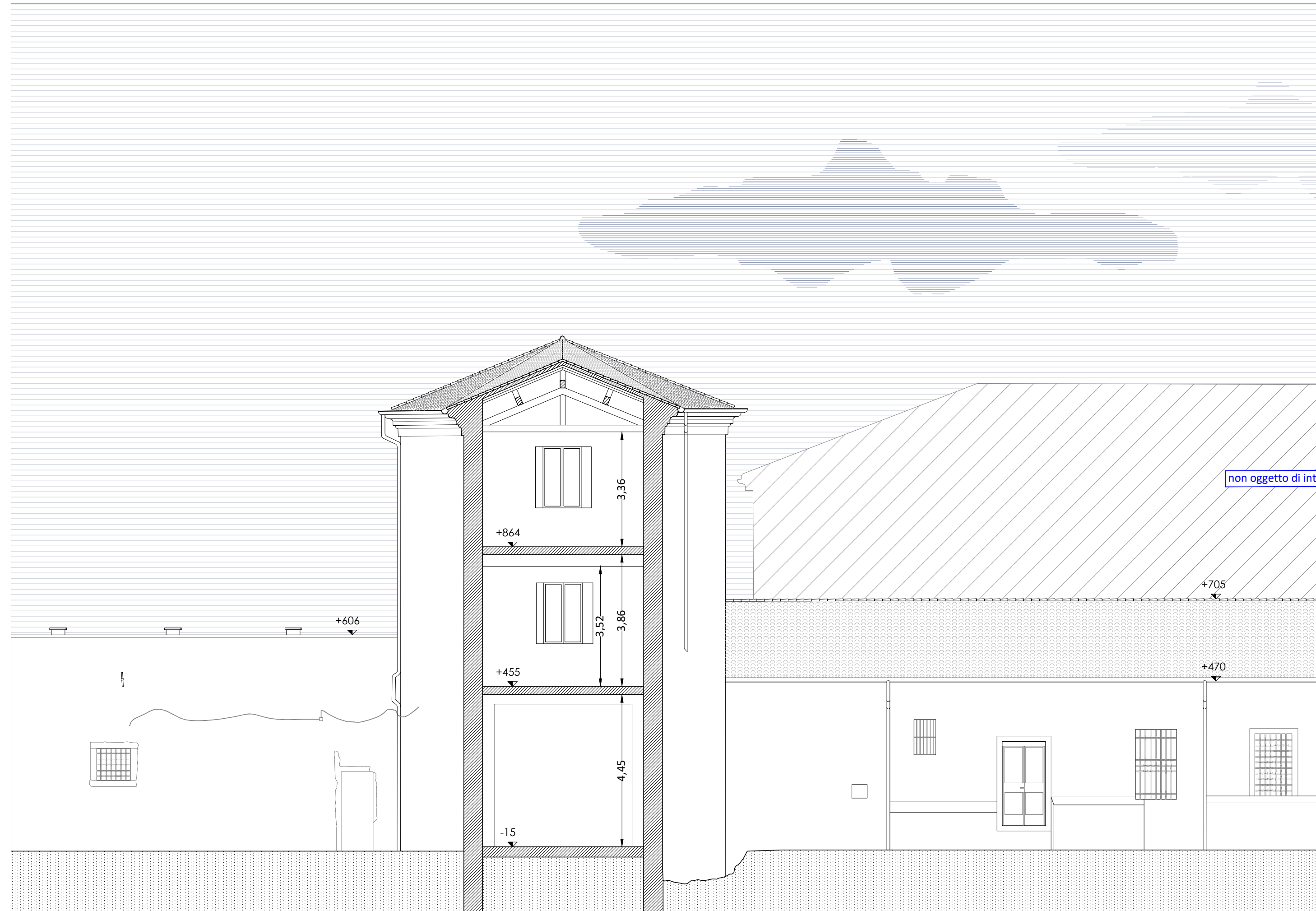
Sezione D-D' - scala 1:100