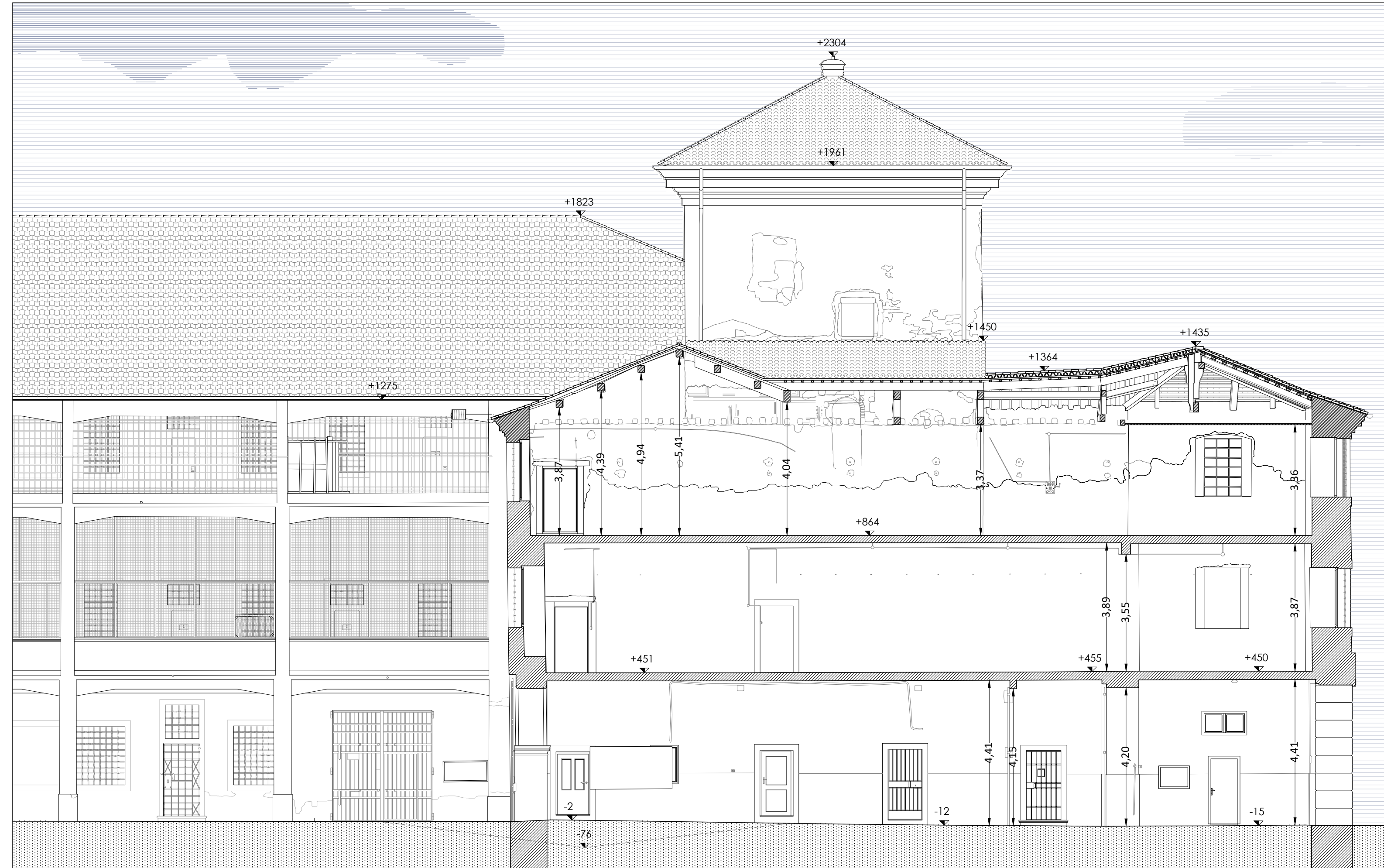
Sezione C-C' - scala 1:100