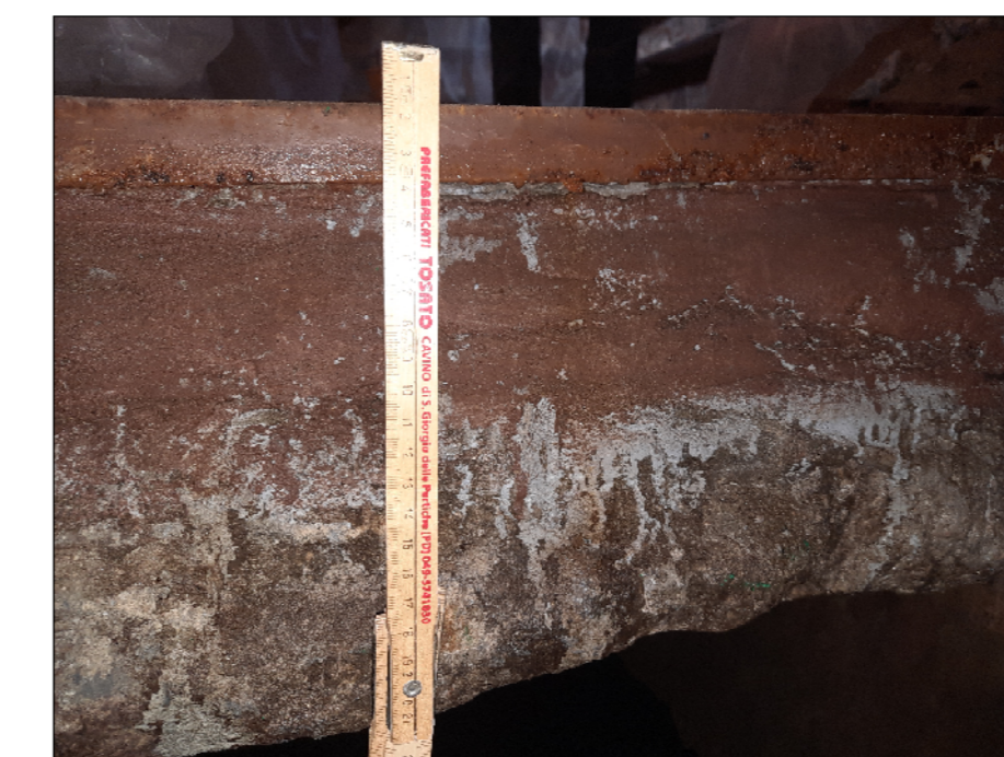
SONDAGGIO 3 BOTOLA rapp. 1:10