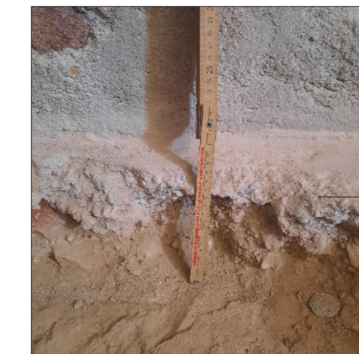
Massetto in CLS 8/10 cm