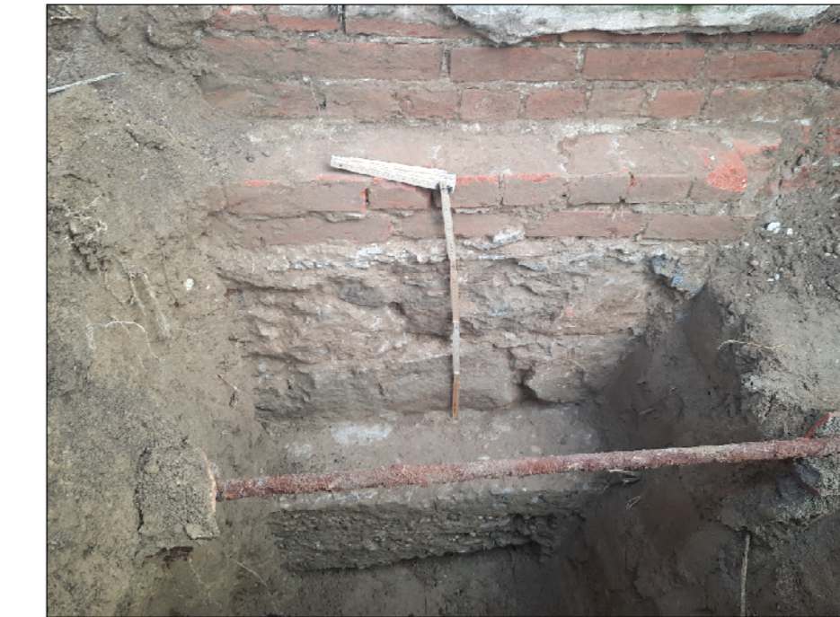
SONDAGGIO 2 PAVIMENTO INTERNO