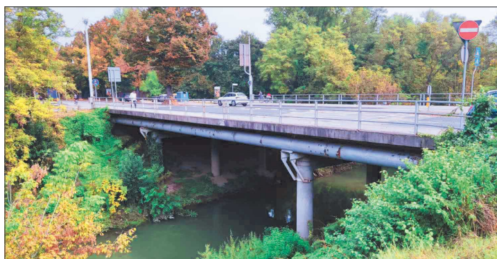
PONTE SULLO SCOLO RONCAJETTE