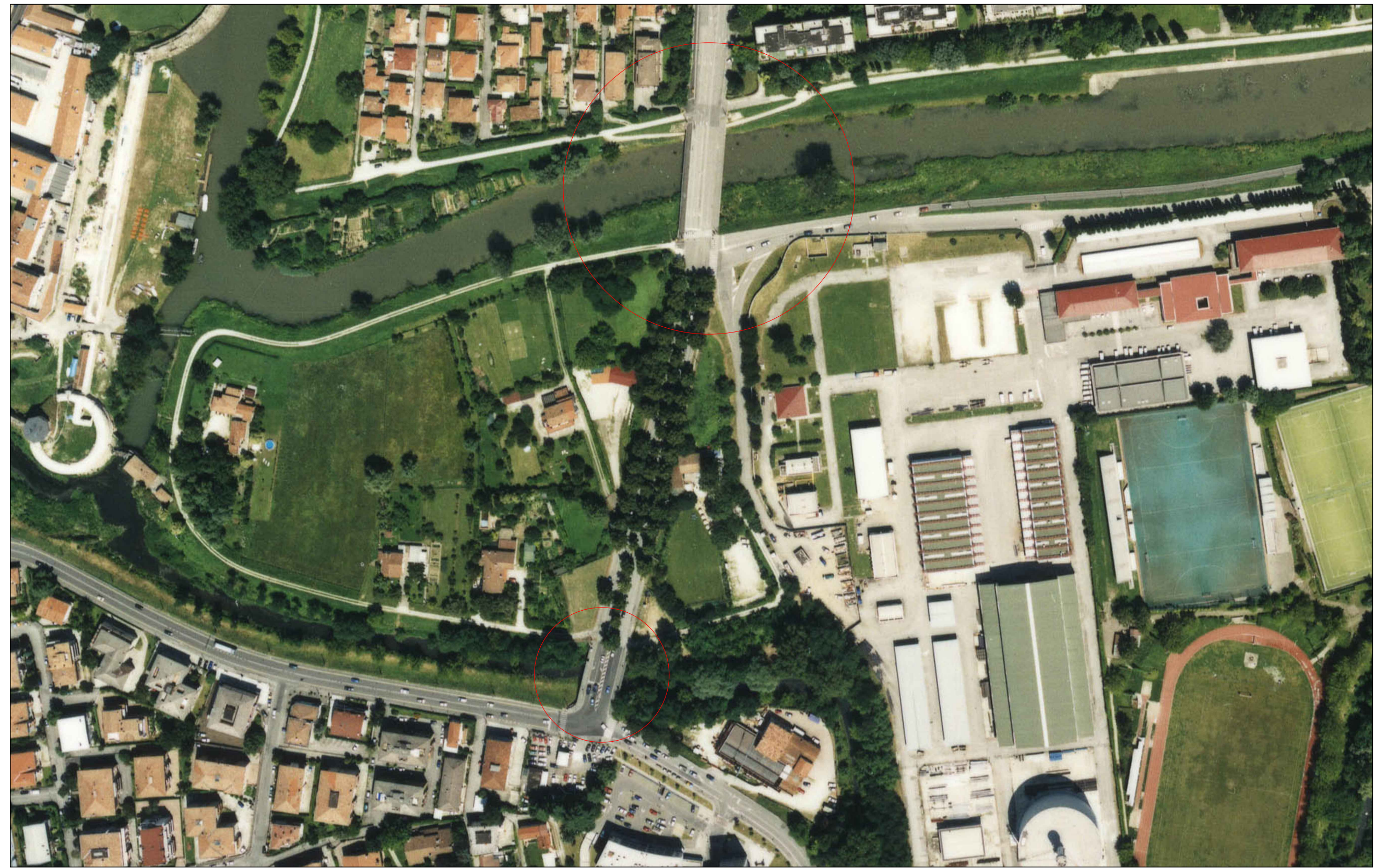
PLANIMETRIA DI DETTAGLIO SU ORTOFOTO