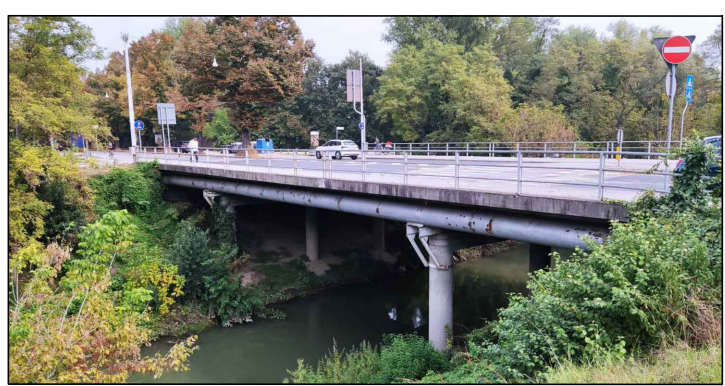
PONTE SULLO SCOLO RONCAJETTE