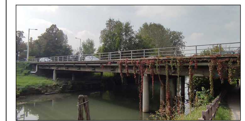
PONTE SUL CANALE PIOVEGO