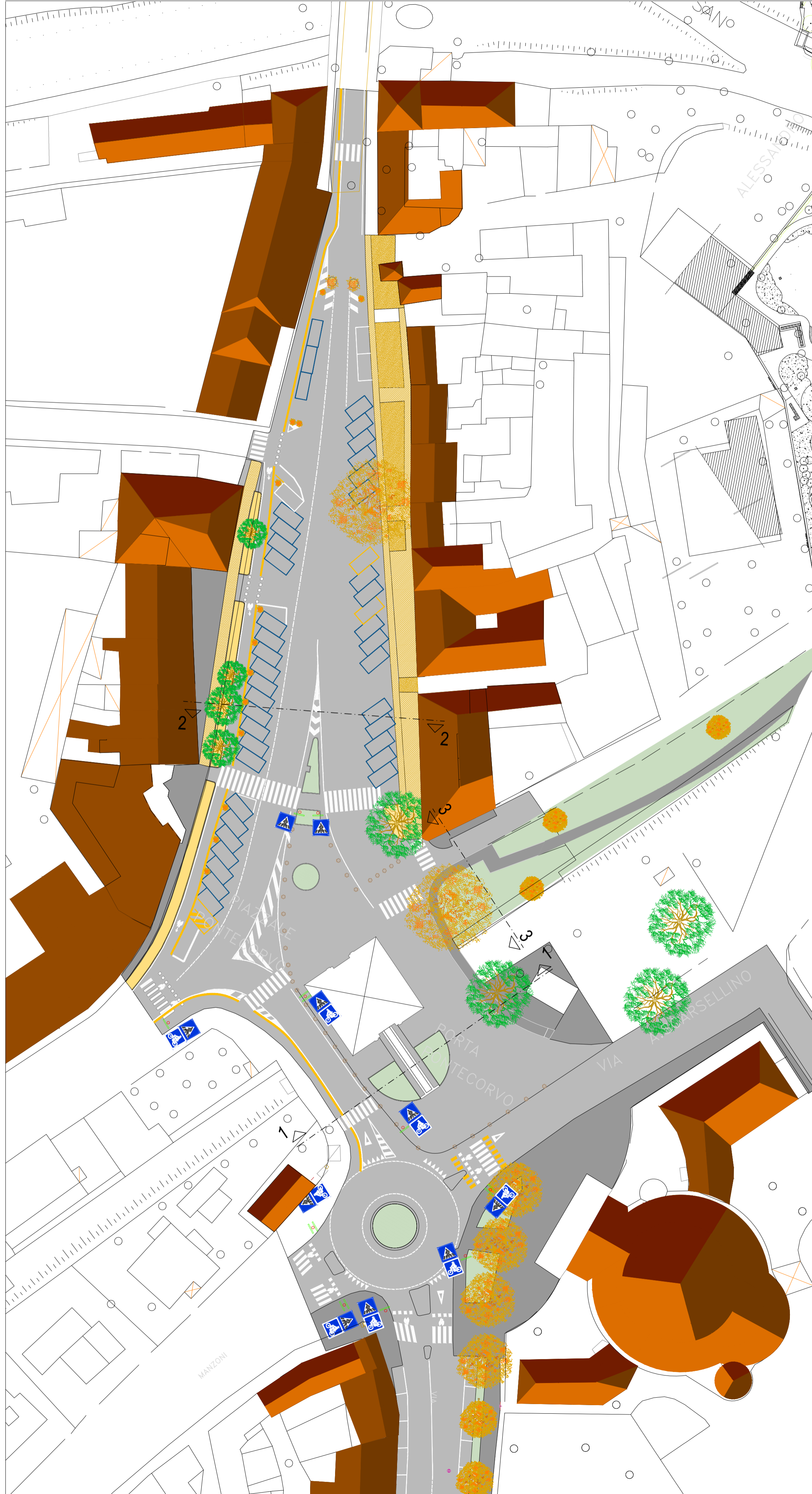
Stato di Fatto Planimetria Generale - 1° Tratto - scala 1:500