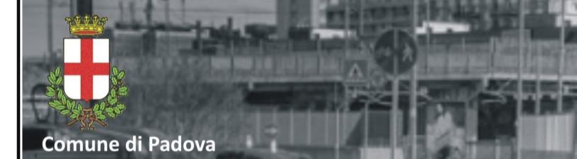
Tavola 01 RETE CICLABILE ESISTENTE