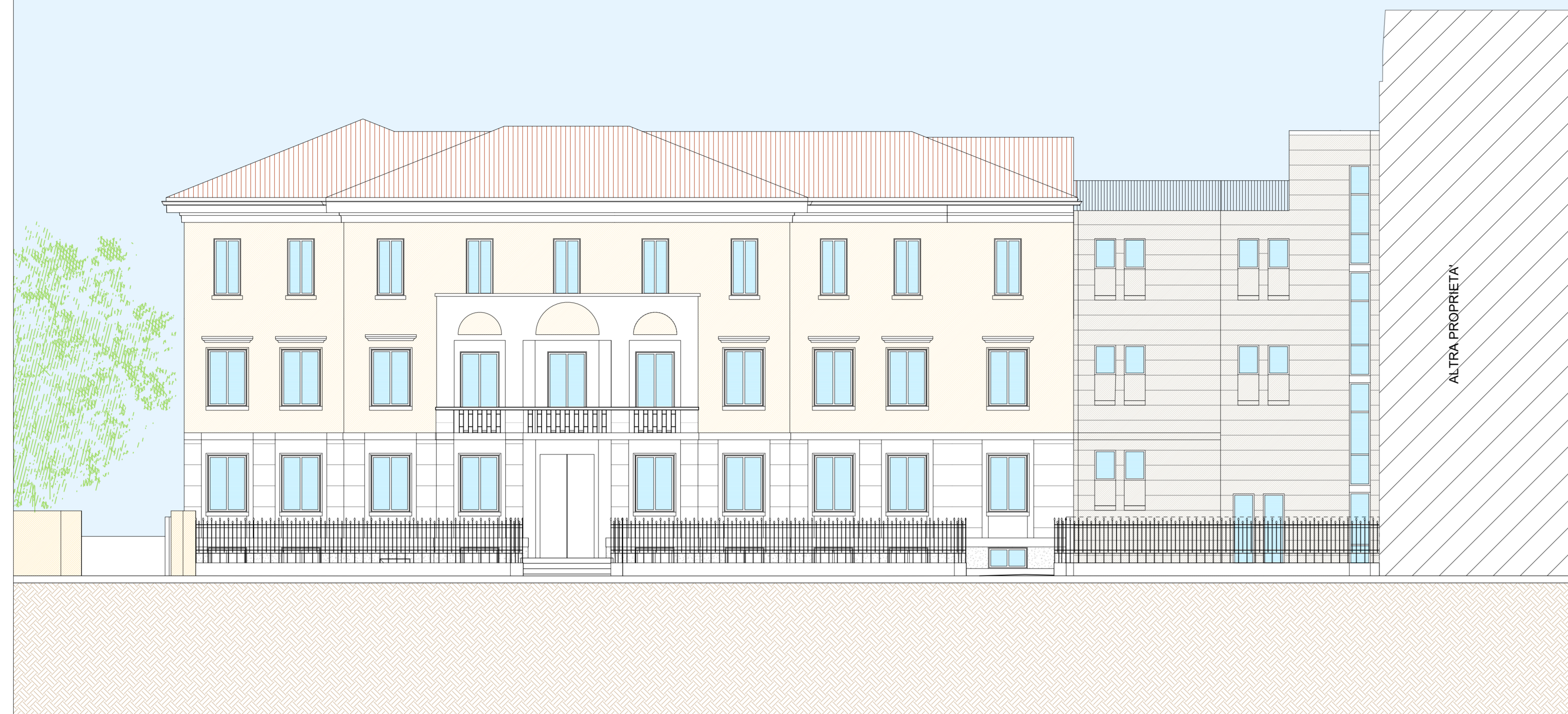
PROSPETTO SUD OVEST