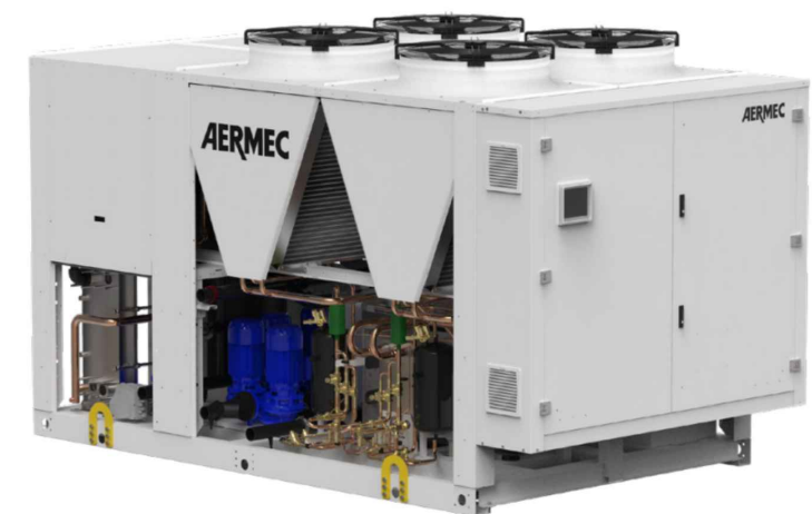
POMPA DI CALORE POLIVALENTE