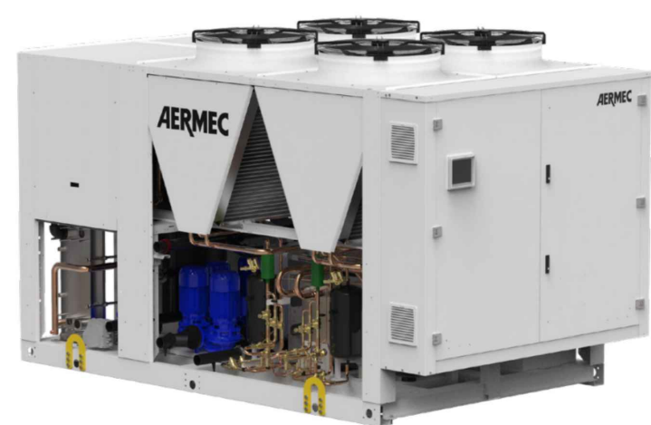
POMPA DI CALORE POLIVALENTE