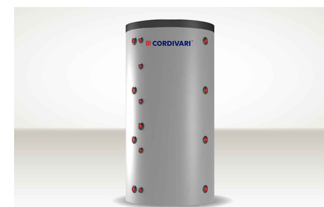
BOLLITORE PER PRODUZIONE ACS