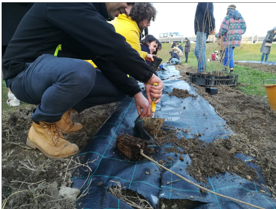
Figura 3. Nuovo impianto di alberi forestali Padova O 2