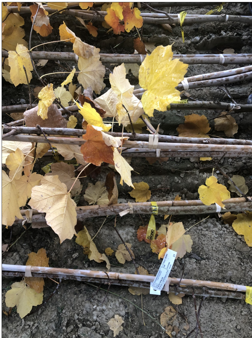
Figura 4. Individui di Acer opalus nel sito di stoccaggio

Infine, ma non ultimo per importanza, migliorerà l'aspetto estetico dei parchi e dei giardini in quanto le 83 specie scelte non sono solo maggiormente resilienti nei confronti del cambiamento climatico in atto, ma sono anche specie ornamentali di pregio per i viraggi cromatici delle foglie ( Fagus sylvatica var. Dawyck , Ginkgo biloba , Acer ginnala , Liquidambar styraciflua ed altre) o per le fioriture belle e precoci ( Cercis siliquastrum , Magnolia x soulangeana ed altre).