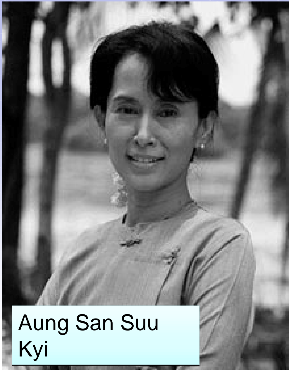
Aung San Suu Kyi

Aung San Suu Kyi è una politica birmana, attiva da molti anni nella difesa dei diritti umani sulla scena nazionale del suo Paese, devastato da una pesante dittatura militare, imponendosi come leader del movimento non-violento, tanto da meritare i premi Rafto e Sakharov, prima di essere insignita del premio Nobel per la pace nel 1991.