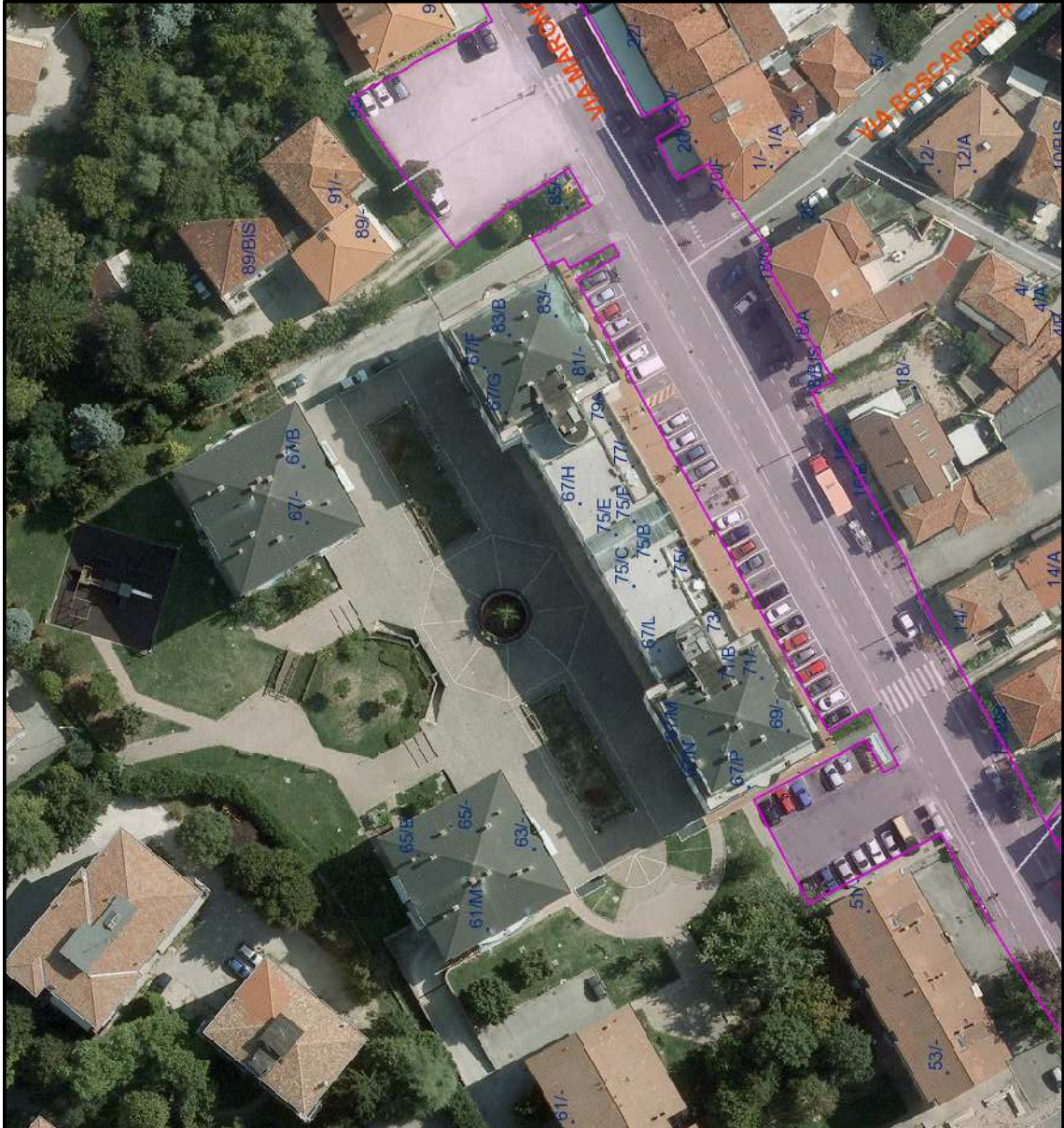
ESTRATTO AEROFOTOGRAMMETRICO sc.1:1000