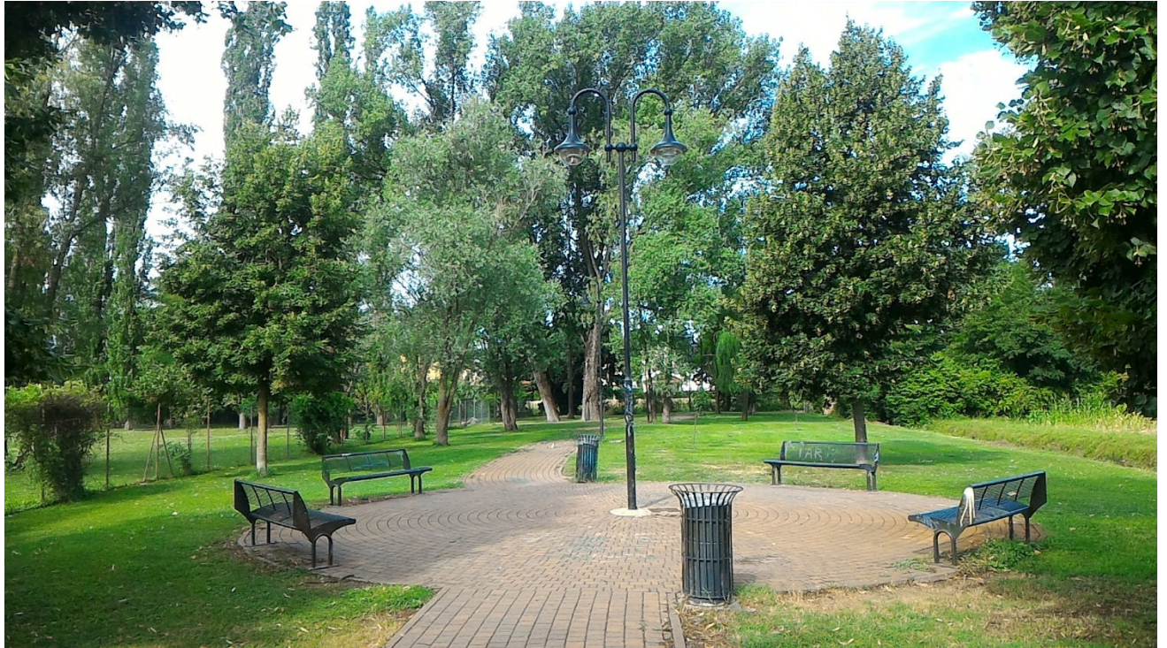
Piazzetta sulla zona di parco esistente