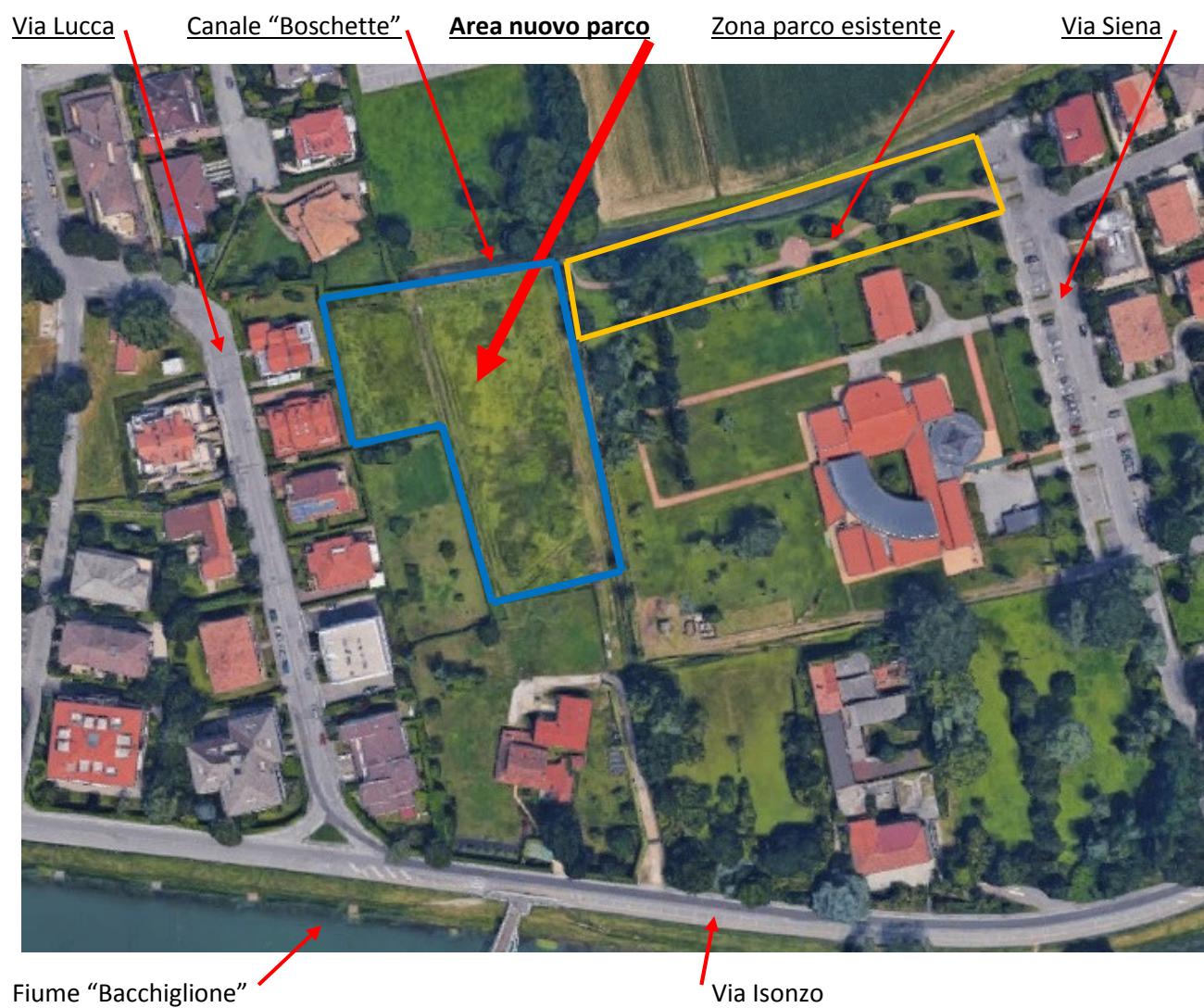
Vista aerea della zona