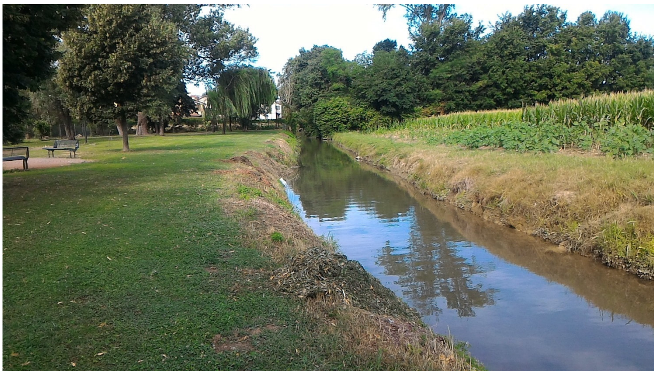
Il Canale “Boschette” limitrofo alla zona di parco esistente