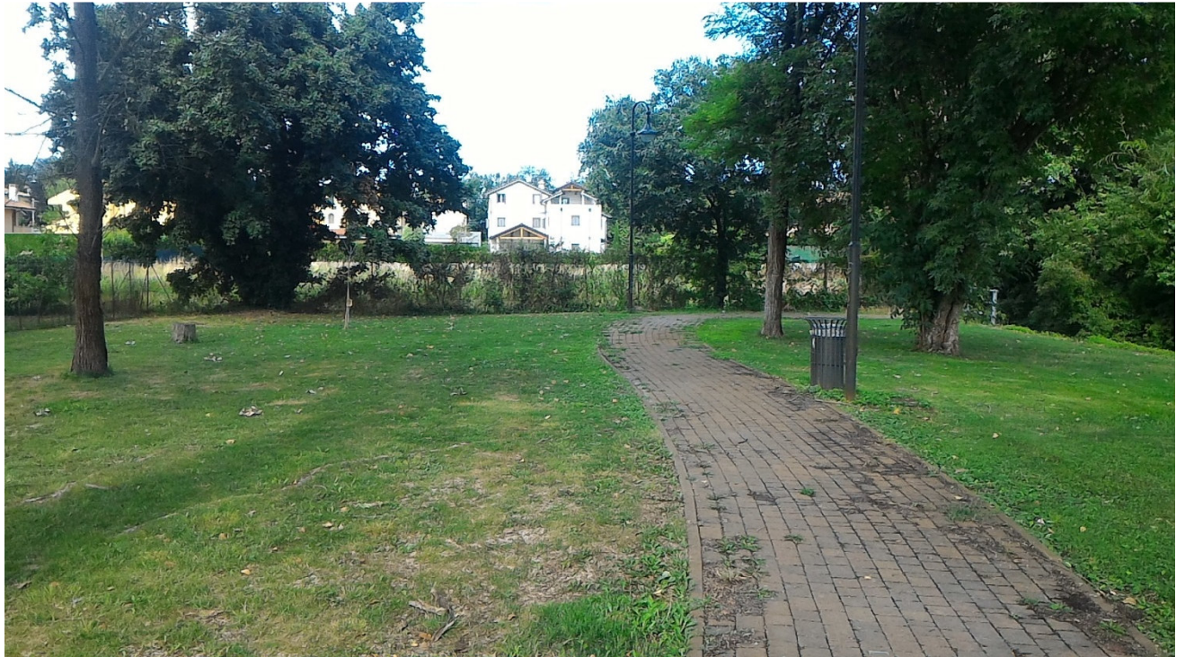
Verso la fine della zona di parco esistente