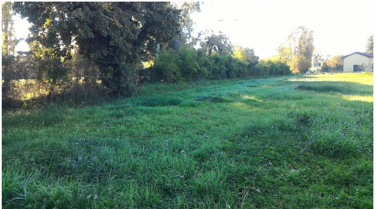
Vista da nord verso sud-est