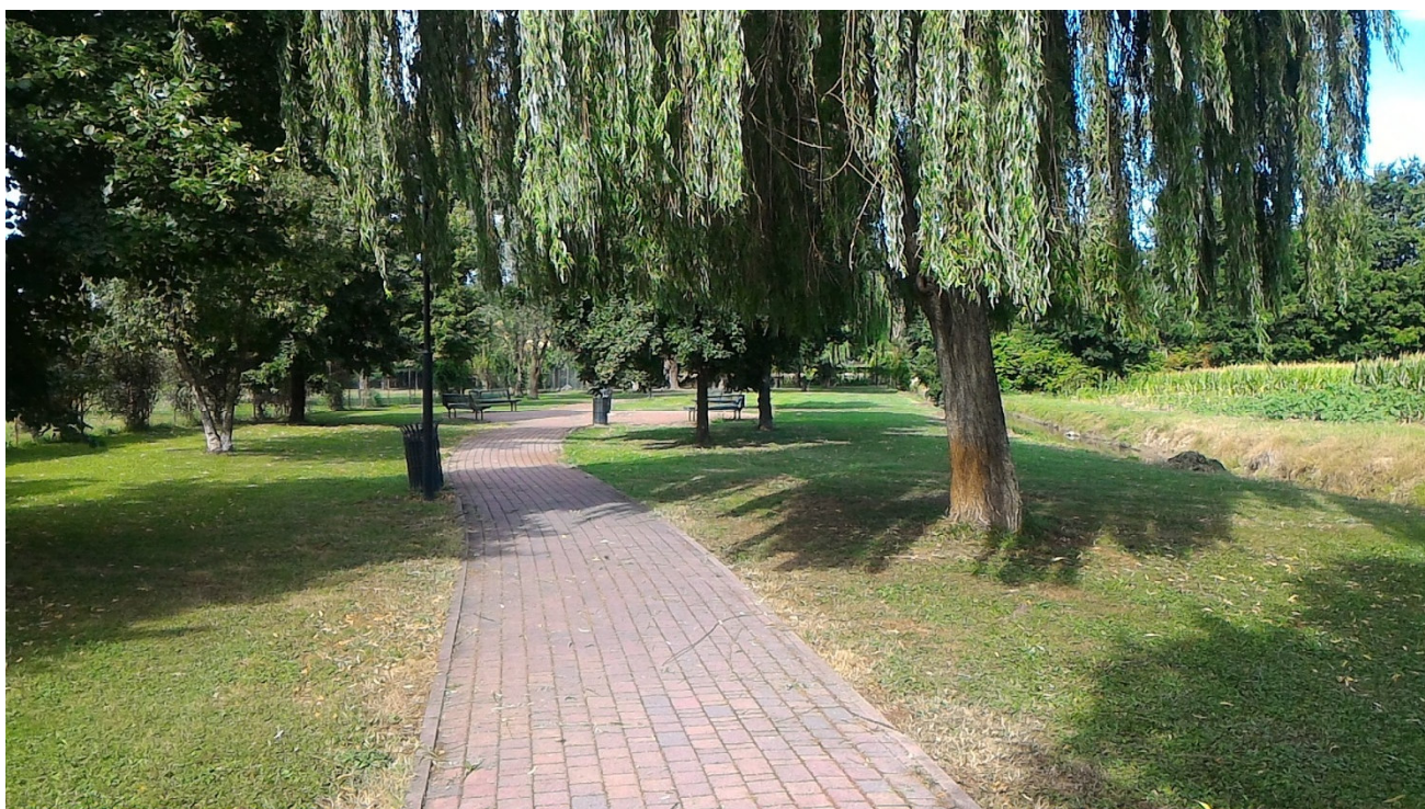
La zona di parco esistente proseguendo verso la zona ove si svilupperà il nuovo parco