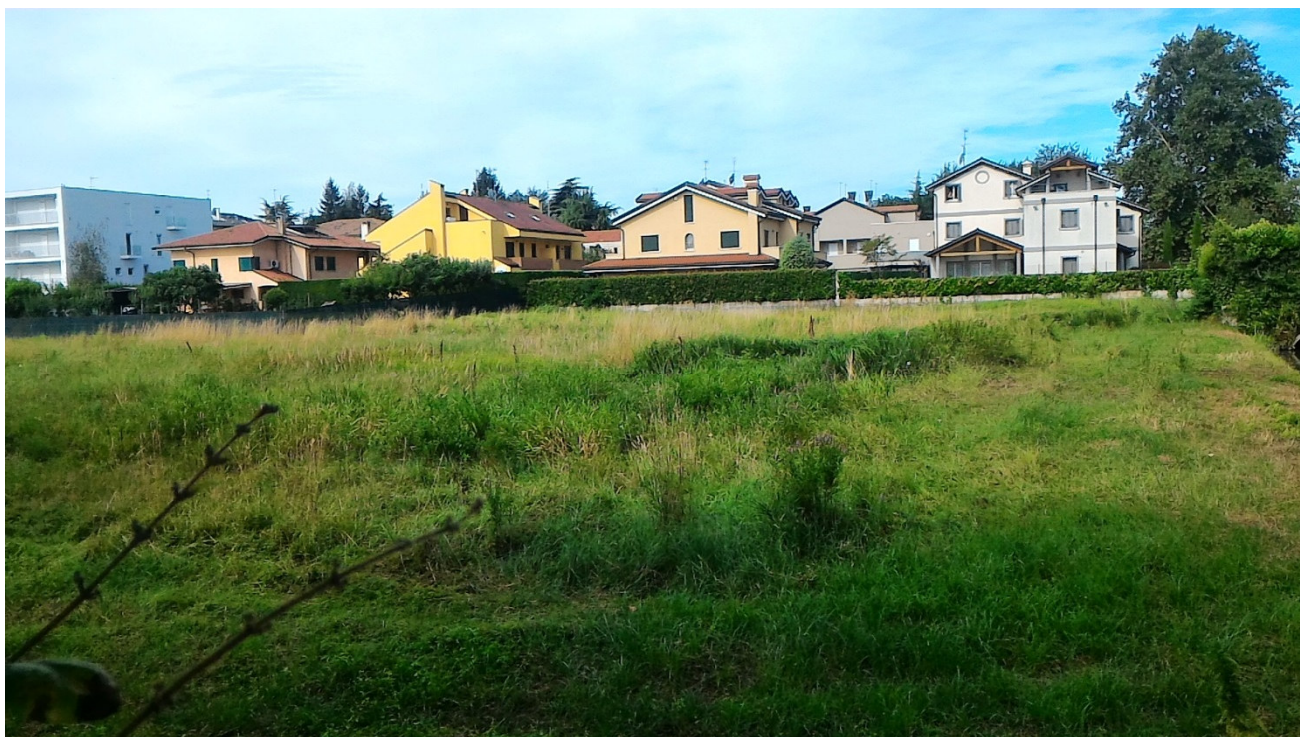
L'area ove si svilupperà il nuovo parco