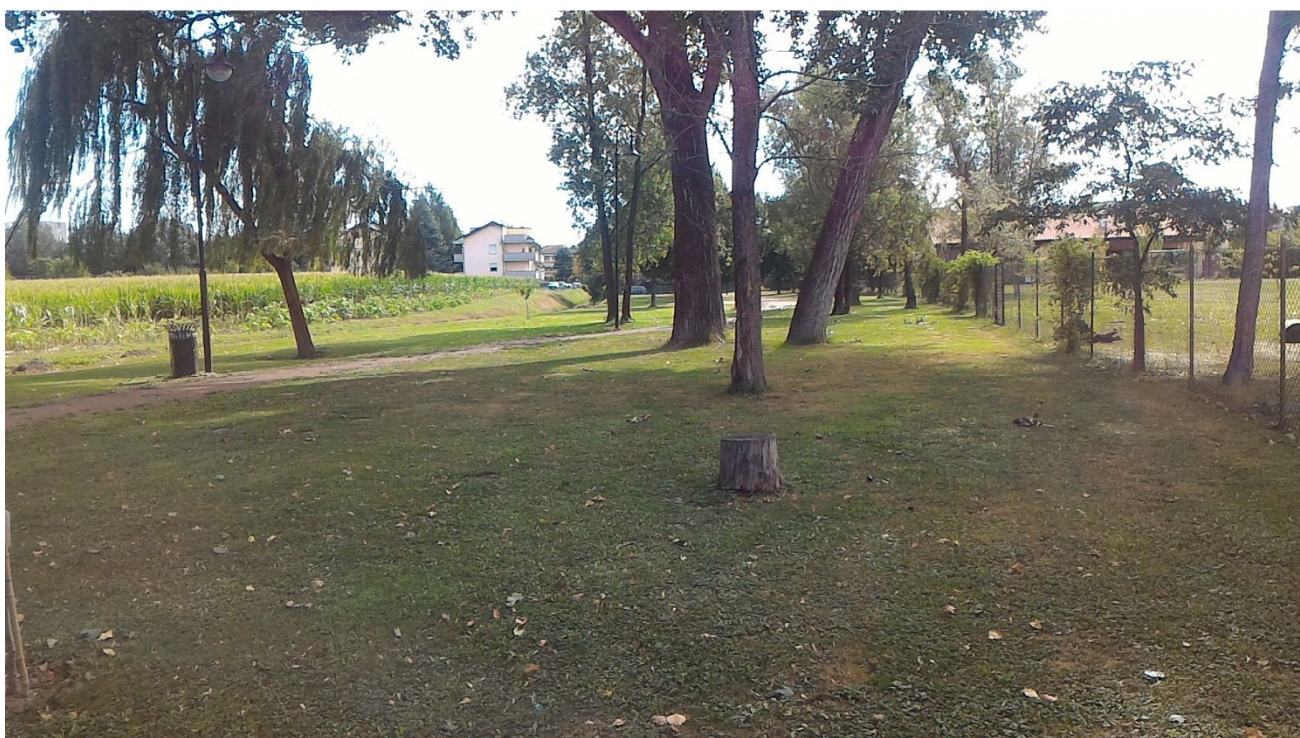
La zona di parco esistente visto da ovest dalla zona attigua ove si svilupperà il parco