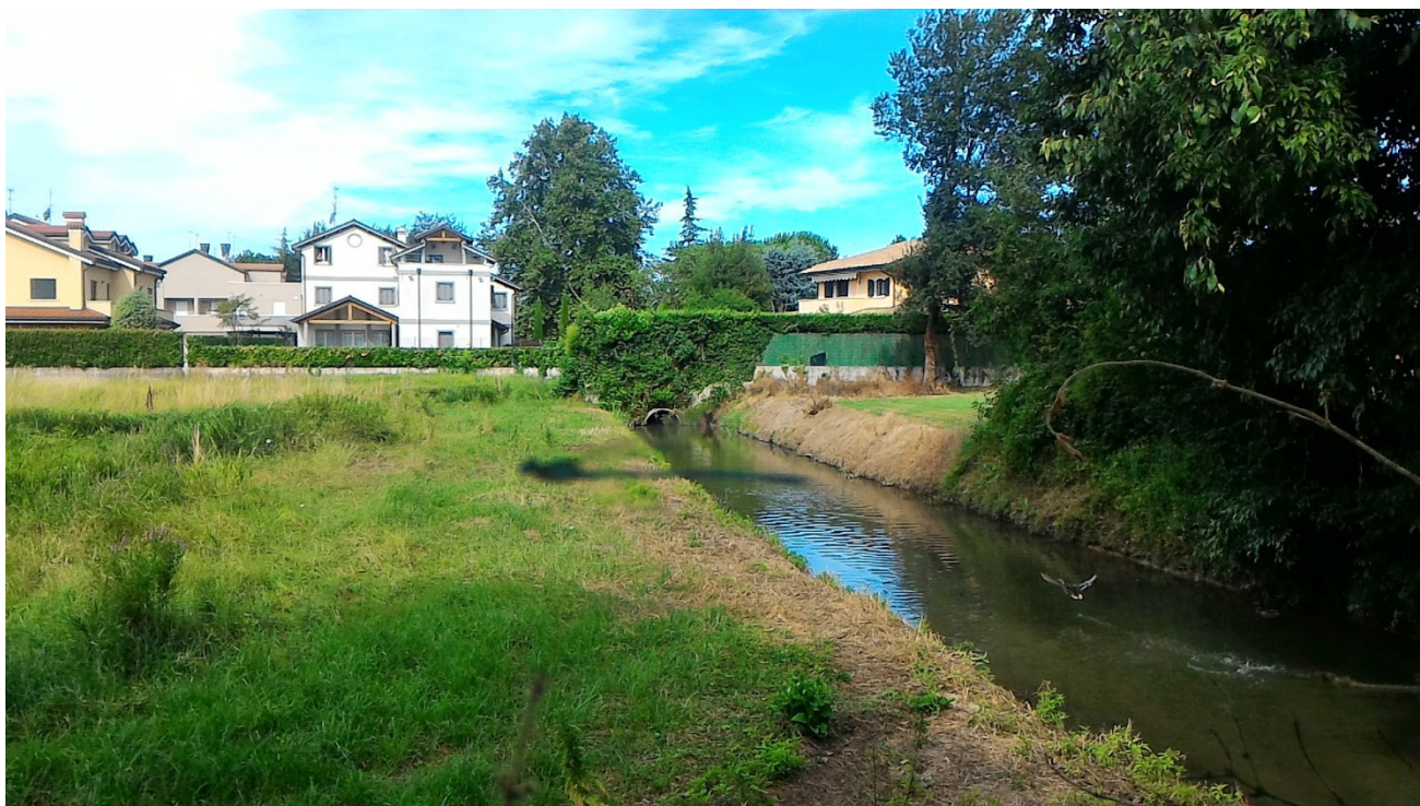
Il Canale "Boschette" limitrofo alla zona ove si svilupperà il nuovo parco