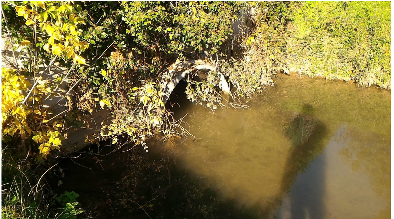
Il Canale Boschette intubato (a ovest)