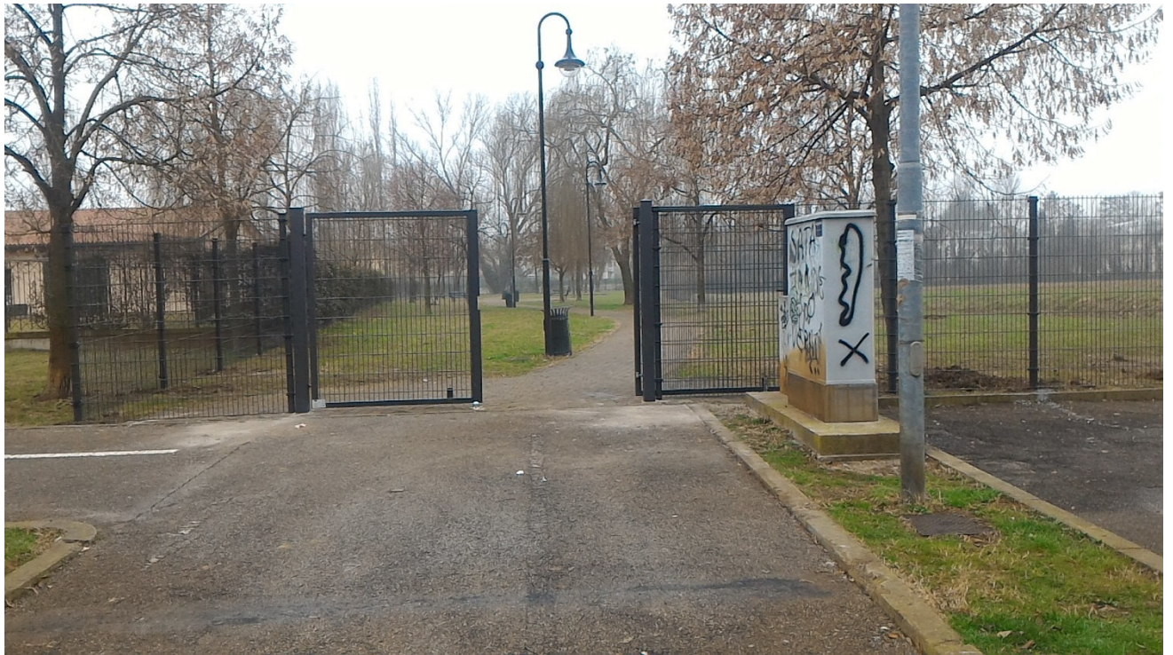
Ingresso da Via Siena della zona di parco esistente