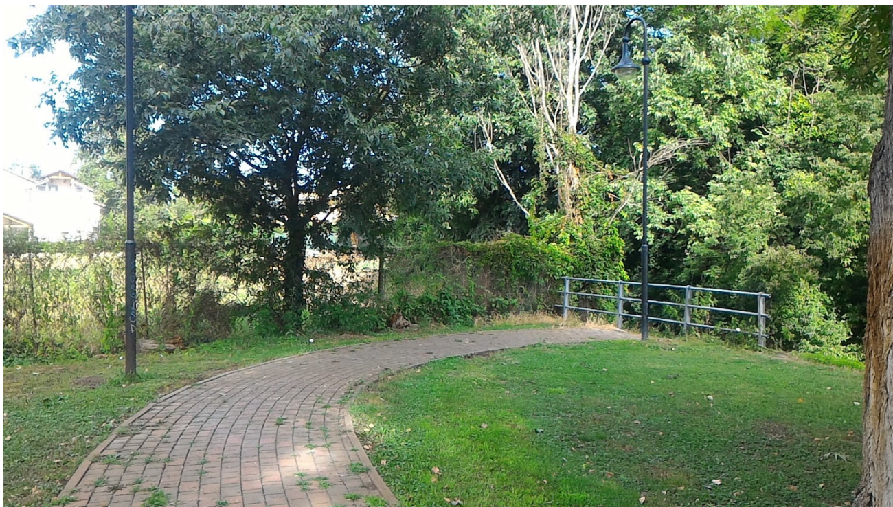
La fine della zona di parco esistente; posizione per nuovo ponticello ciclopedonale