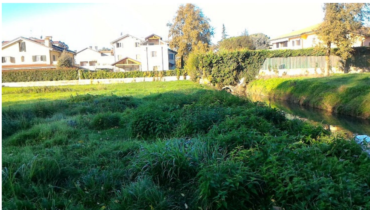
Vista confine nord