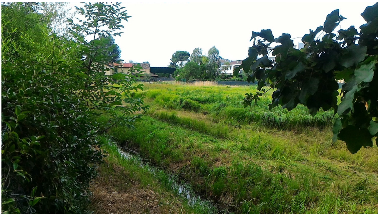
L'area ove si svilupperà il nuovo parco In primo piano canalina naturale acque risorgive sfocianti nel Canale Boschette