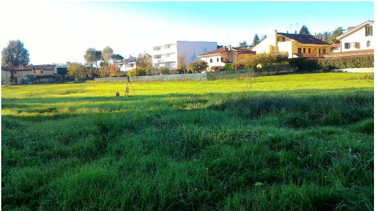
Vista da nord verso sud-ovest