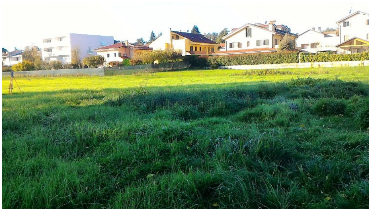
Vista da est verso ovest