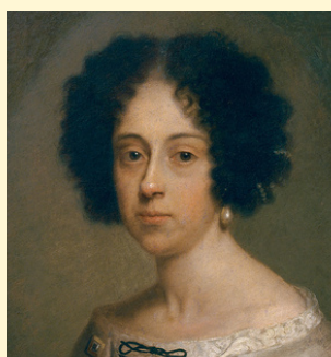
ELENA LUCREZIA CORNARO PISCOPIA (VENEZIA, 5 GIUGNO 1646 – PADOVA, 26 LUGLIO 1684)