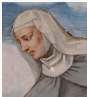
SIBILIA DE CETTO (PADOVA, CIRCA 1350 – PADOVA, 12 DICEMBRE 1427)

Fina Buzzaccarini fu una nobildonna padovana colta e potente. Commissionò a Giusto de' Menabuoi il ciclo di affreschi che arricchisce l'interno del Battistero del Duomo di Padova per farne il suo mausoleo. Fina sostenne la spesa con fondi propri e chiese di comparire nelle scene dipinte insieme alla sorella e alle figlie come celebrazione del suo stesso ruolo sociale. Il ciclo affrescato da Giusto de' Menabuoi è inserito nel Sito Patrimonio Mondiale "I cicli affrescati del XIV secolo di Padova".