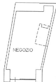
Piano Terra H=3.05